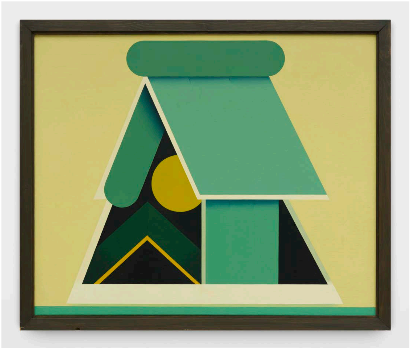
Auvent, 1969