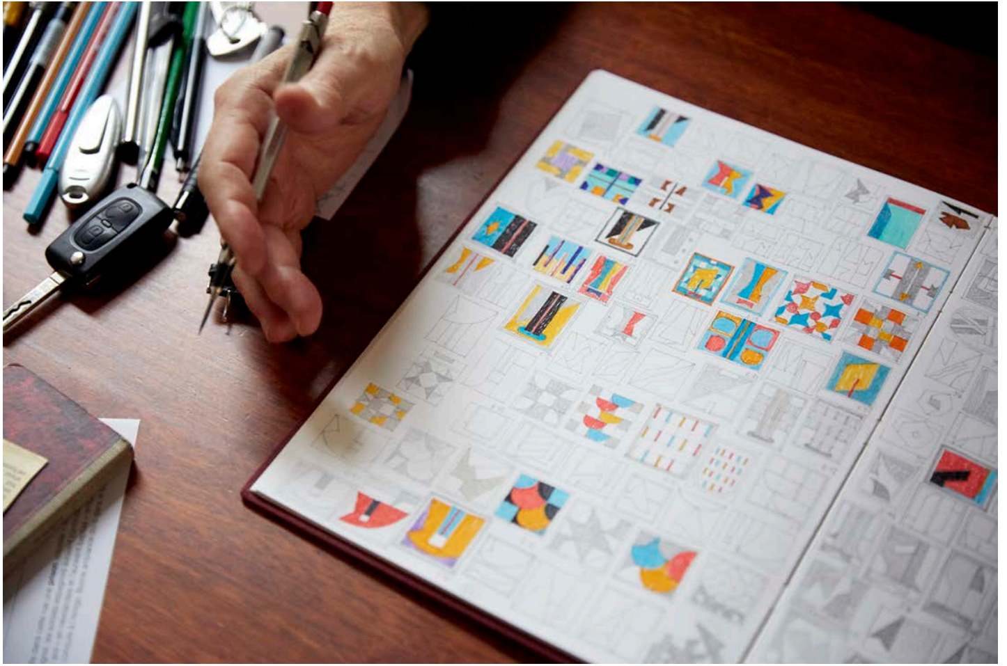
Beeld uit het online artikel 'Dans l'atelier de Léon Wuidar', Mu in the City, 10 januari 2017.