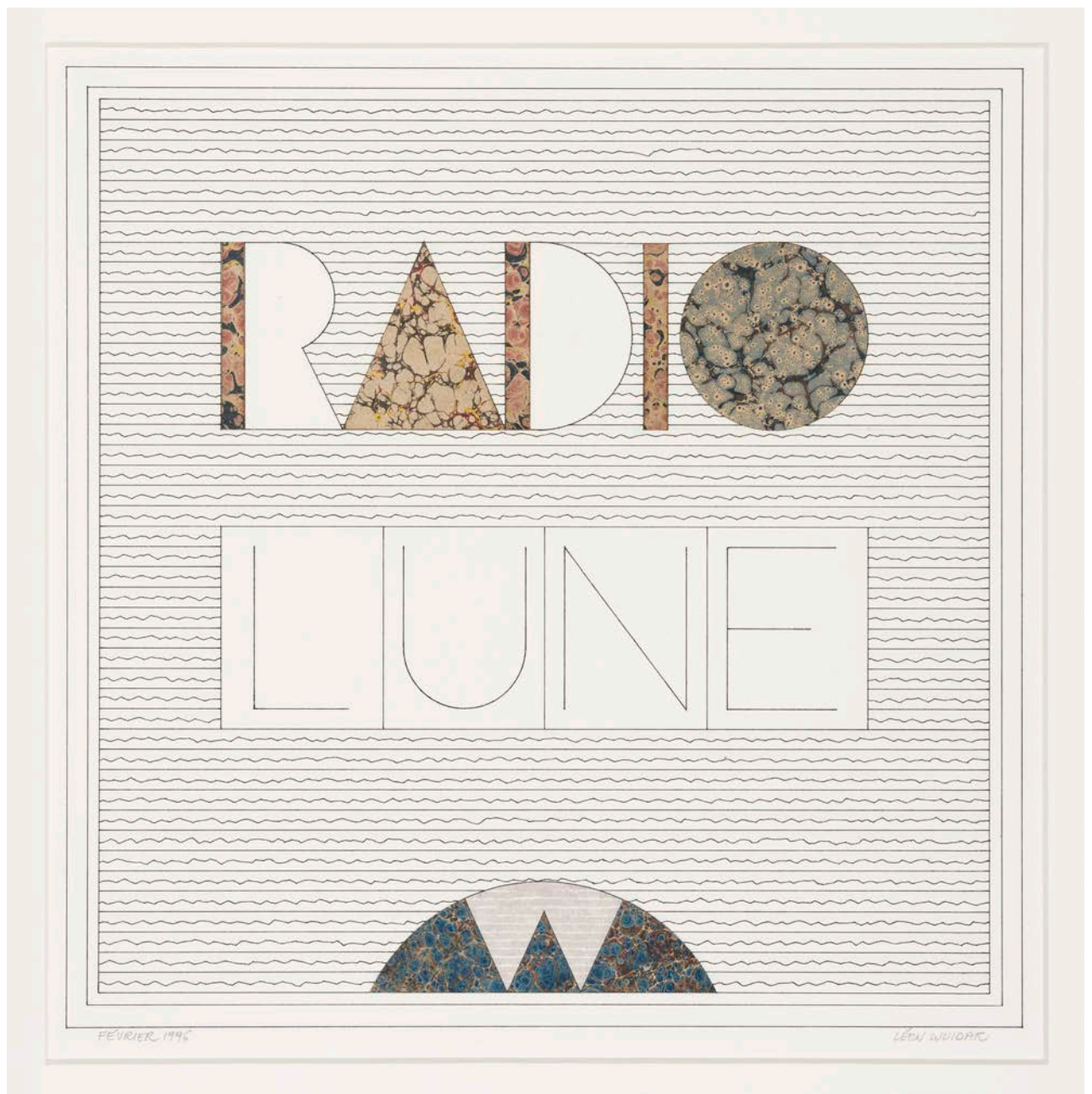
Radio Lune Chinese inkt en collage op papier, 1996.